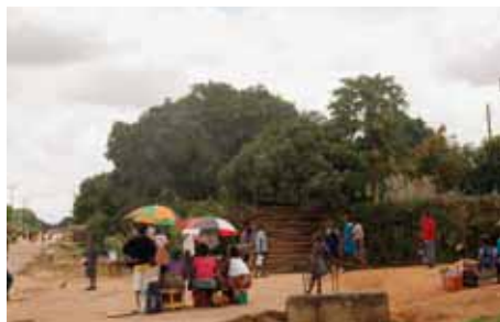
Une vue du quartier de Lwanga dans la ville de Kitwe en Zambie.

Parmi les difficultés que je rencontre, il y a celle de la langue. Je ne maîtrise pas