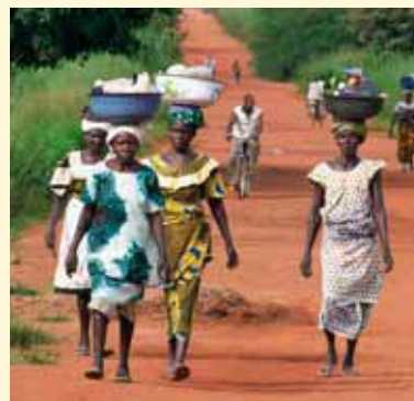
Retour de marché à Dikodougou, Côte d'Ivoire.

Il s'agit d'un bâtiment de 23 mètres sur 13 mètres avec deux entrées indépendantes, une issue de secours, un plan incliné pour l'accès aux handicapés et un rideau central amovible. Il pourrait accueillir soit une assemblée de deux cents personnes, soit deux groupes indépendants disposant chacun de tables, bancs et tableau mural. Le devis prévoit une dépense de 22 260 euros pour la construction, l'équipement électrique et les peintures, la main-d'œuvre et le transport du matériel. La paroisse a déjà équipé le terrain en construisant des latrines pour 1 486 euros et en assurant l'accès à l'eau et l'électricité. Une aide de 5 000 euros serait un secours encourageant pour la communauté chrétienne.