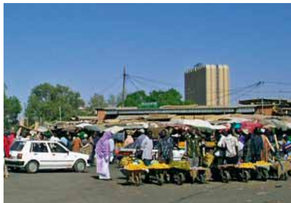
Au marché de Niamey, Niger.

Le Bénin, pour sa part, est entré depuis vingt ans dans l'ère démocratique avec une alternance au pouvoir après des élections crédibles. Boni Yayi, président élu depuis 2006, se présentait pour un deuxième mandat. Après bien des turbulences autour des listes électorales informatisées, et des reports de la date des élections, Boni Yayi a remporté la majorité absolue dès le premier tour du 13 mars 2011, créant la surprise y compris dans son