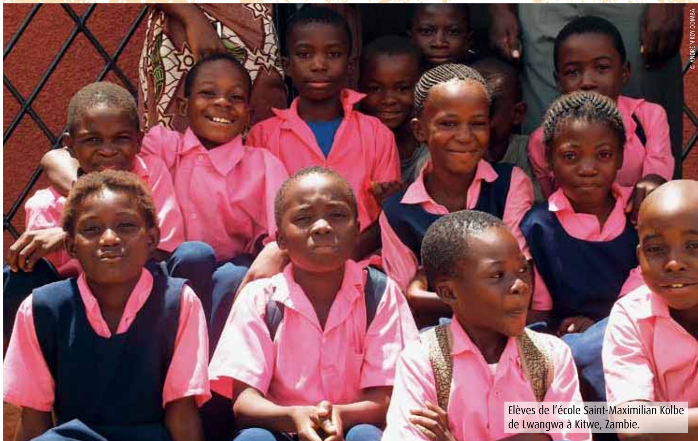
Elèves de l'école Saint-Maximilien Kolbe de Lwangwa à Kitwe, Zambie.

Trimestriel - N° 245 - Juin-Juillet 2011