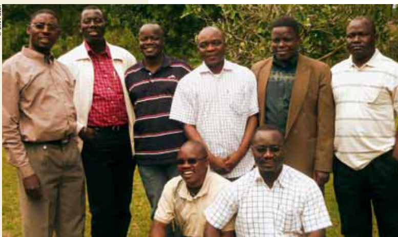
Prêtres sma responsables des vocations missionnaires au Congo (RD), Ghana, Kenya, Tanzanie et Zambie.