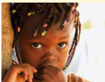
Visage de Tabou, Côte d'Ivoire.

Nous disposons de deux véhicules : une Nissan Terrano 4X4 (bientôt dix ans d'âge et plus de 215 000 km) et une Nissan bâchée (treize ans et plus de 200 000 km). A présent ces véhicules sont en état d'urgence car ils consomment trop et leur entretien coûte cher.